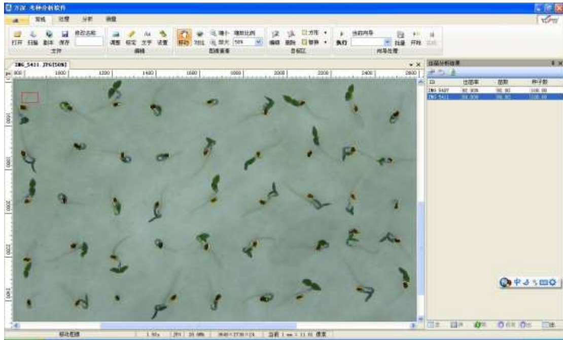
烟草种子出苗率分析的操作界面

2、主要用途： SC-G 型自动种子考种分析及千粒重仪系统是根据图像识别原理来实现自动分析的。目标照明模式可在背光和普通日光之间切换。可用于各类农作物实粒种子（谷粒、玉米、小麦、油菜籽等）的精确考种、各类粮库的虫口计数分析，以及出苗数、整齐度、均匀度分析，可兼做表面光滑的昆虫计数或虫卵计数（如：米象、蚜虫、蚕卵、鱼籽等），以及被当作种子净度工作台用于种子净度检验。内置支持网上在线升级的模块。