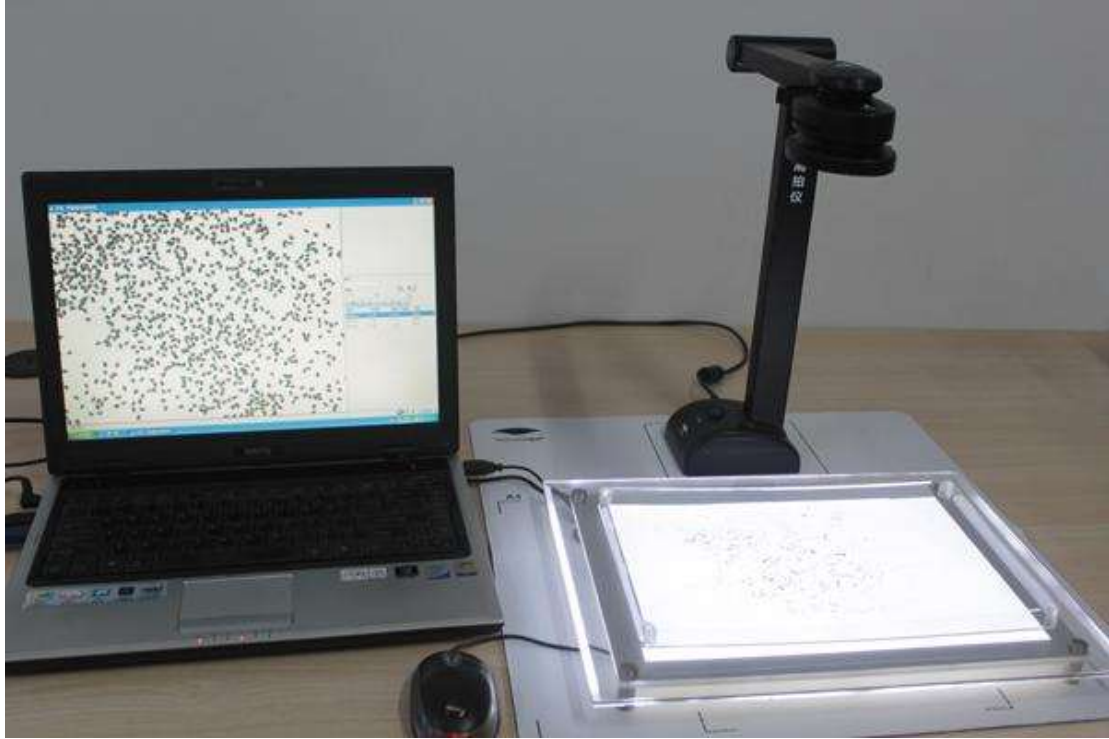
标配的种粒自动考种分析及千粒重仪